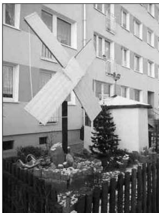
Sposób na kryzys - tania (eko)energia wiatrowa