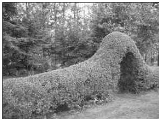
Tajemniczy ogród - wejście