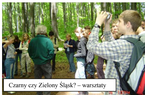
Czarny czy Zielony Śląsk? – warsztaty

O działalności szkół najłatwiej jest mi opowiadać na przykładzie mojej szkoły. Co roku bierzemy udział w akcji sprzątania świata. Wydawałoby się, że to zwykłe „zbieranie papierków” w parku. Udział w akcji uczy współodpowiedzialności za otoczenie. W atrakcyjny sposób organizujemy realizację ścieżki ekologicznej w formie obchodów tygodnia ziemi. Pierwsza ścieżka miała tytuł