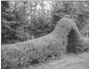
Tajemniczy ogród - wejście