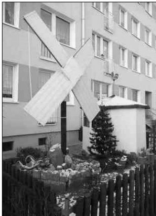
Sposób na krzyż - tania (eko)energia wiatrowa